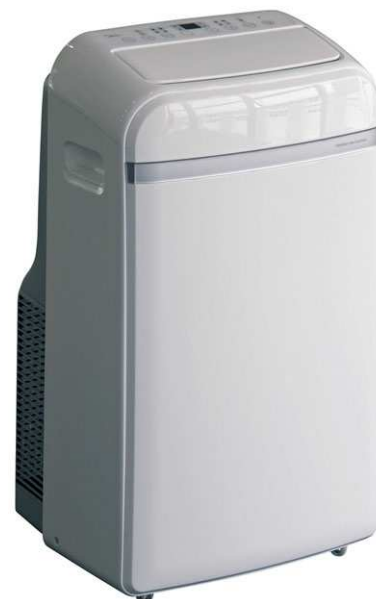
FW4-09-BC (Bomba calor)