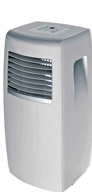
FW4-07-SF (Sólo frío)

reducción de la humedad restableciendo una temperatura óptima en ambientes húmedos